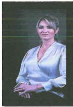
DIP. CELIA JAUREGUI IBARRA