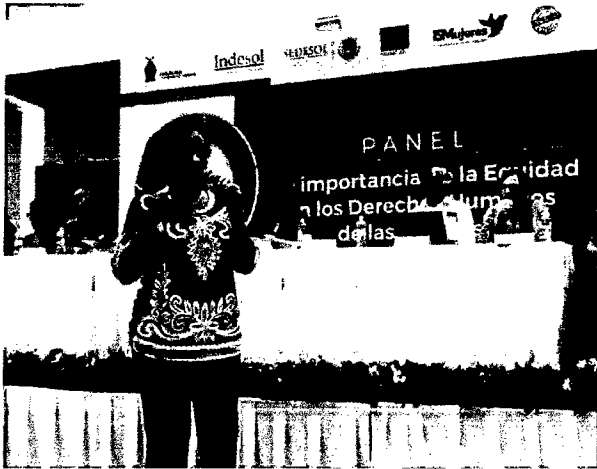
Panel "La importancia de las mujeres en los Derechos humanos de las Mujeres.