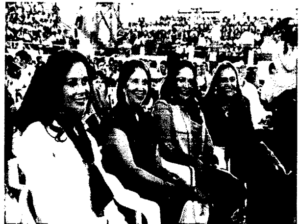
Taller "Violencia es Violencia"