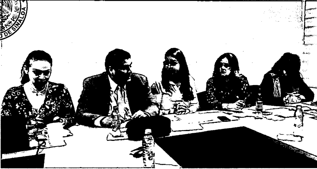
Reunión de la Comisión de Equidad, Género y Familia donde se analizaron las iniciativas turnadas que subsanan las observaciones de la AVGM