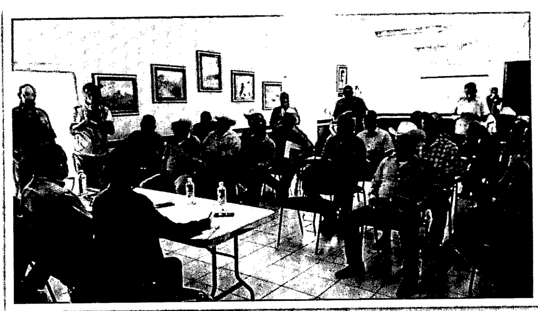
Reunión de trabajo con pescadores de Rosario,

Acudió un numeroso grupo de pescadores a la reunión de trabajo para escuchar la exposición de su problemática en los campos pesqueros y en las cooperativas que representaban.