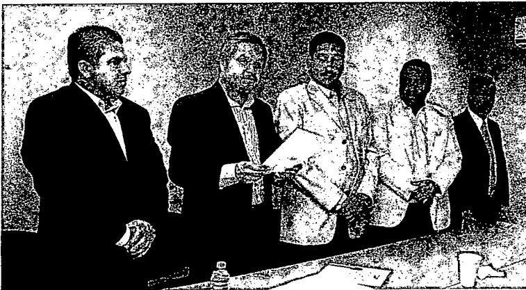
Declaración de instalación de la Comisión de Pesca de la LXI Legislatura

Esta Comisión efectuó su reunión de instalación el día jueves 12 de diciembre de 2013, a las 9:00 horas, en la sala A, del Congreso del Estado, con la asistencia de los cinco diputados integrantes de dicha comisión, quedando así posibilitada para iniciar los trabajos circunscritos a su competencia.