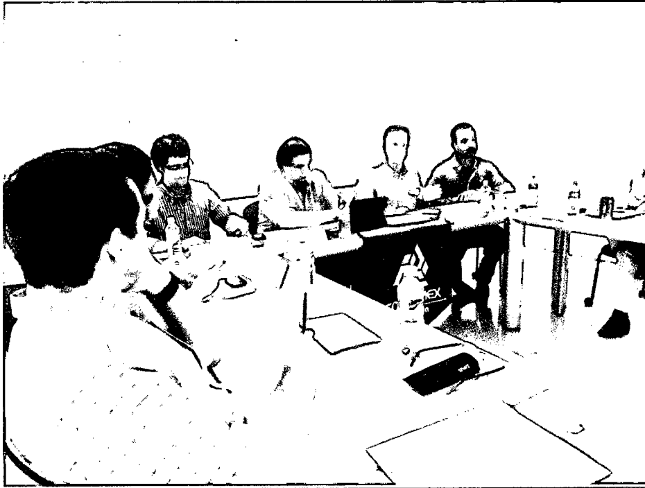
Reunión con el Consejo de Jóvenes empresarios de Sinaloa